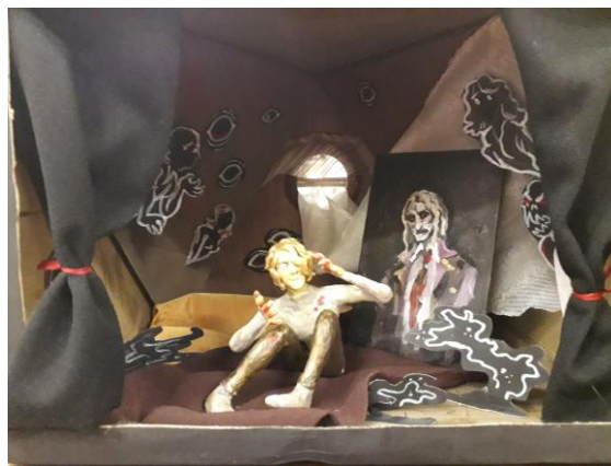
Работы учащихся 10-5 класса к книжной выставке «Дом книги»

Дети не просто погрузились в творчество писателей, они для раскрытия смысла произведений и, следовательно, понимания художественных текстов, соответствующим образом интерпретировали их. Ребята продемонстрировали самостоятельную читательскую работу над текстом и соотнесение текста со своими внутренними установками и представлениями и представили это в своих творческих работах.