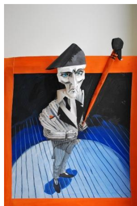
Книжная выставка «Литературное платье» Рисунки и куклы к литературным произведениям